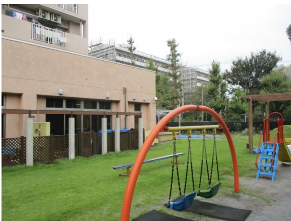
武蔵野市立みどりのこども館