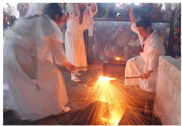
刃物産業の礎となった刀鍛冶