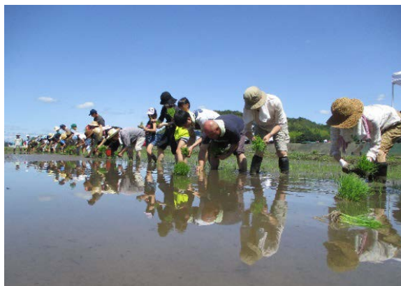
消費者と一緒にこだわりの米づくり