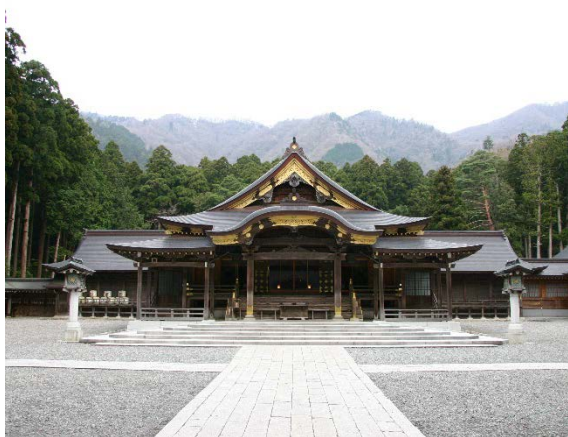
観光の中心「弥彦神社」