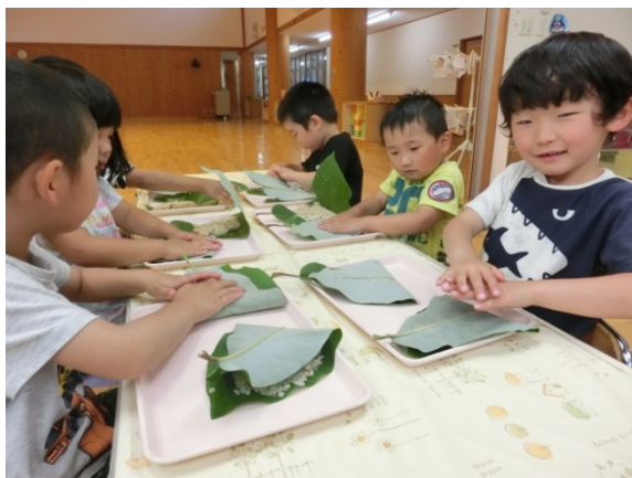
郷土食『ほうば寿司づくり』