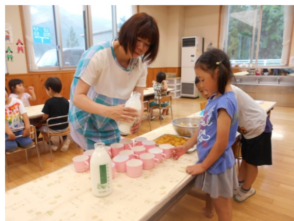
おやつで飲む地元産『ひるがの牛乳』