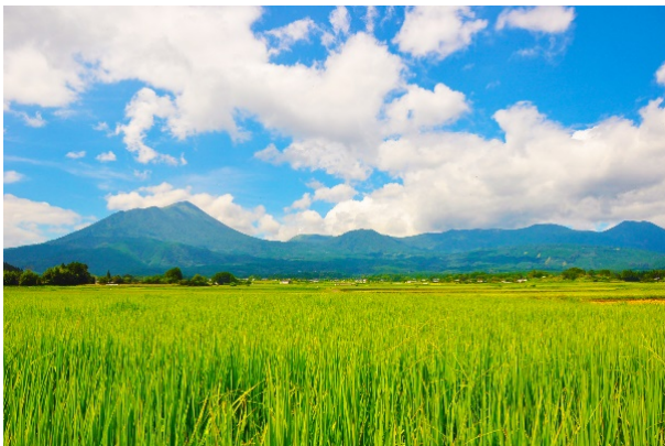
高千穂峰（霧島連山）と水田