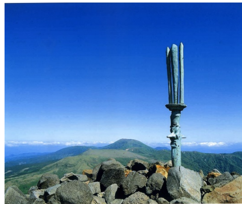
あまのさかほこ 神話のシンボル「天逆鉾」