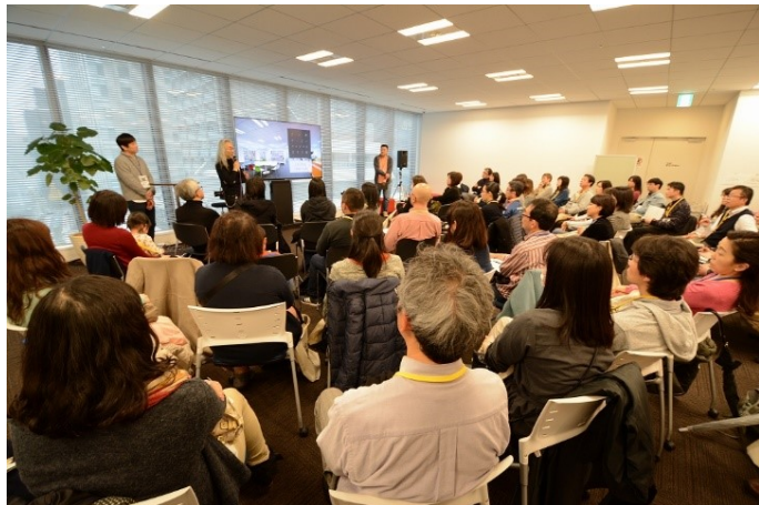
教育関係者、近隣住民を対象とした公開講座