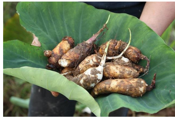
真室川ブランド認定品 伝承野菜 甚五右エ門芋