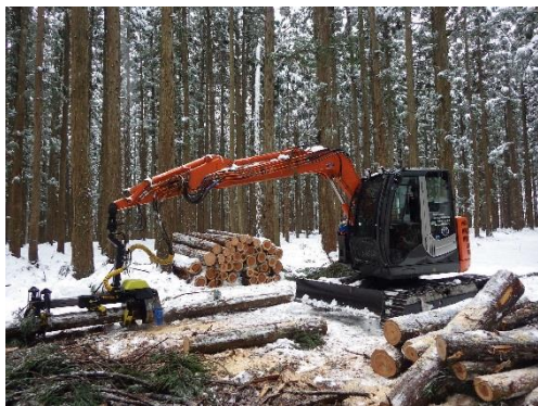
町の主要産業である林業