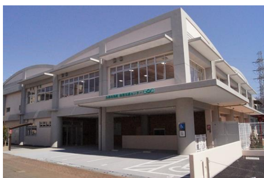
エール（日野市発達・教育支援センター） （児童発達支援センターへの移行施設）