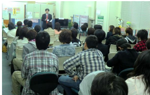
スクーリングの様子 (イメージ)