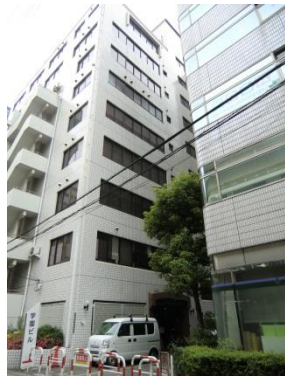
大阪校（学園ビル）の外観 「大阪駅」より徒歩5分