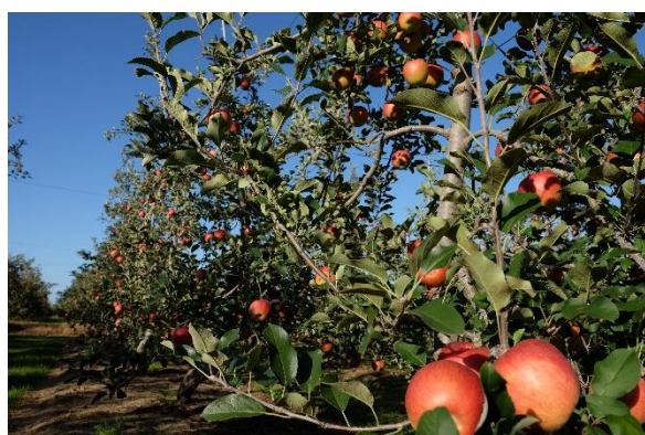
収穫間近のりんご畑