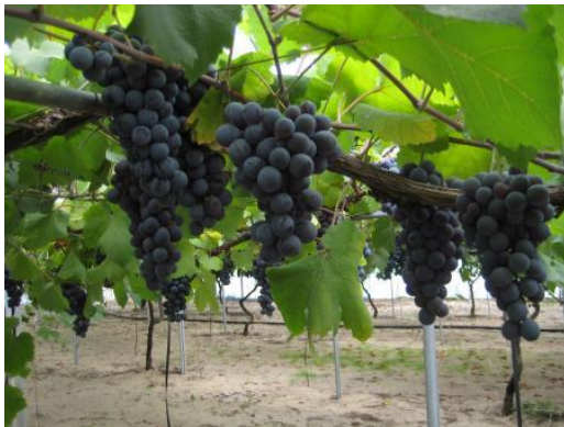
砂丘土壌と山陰の気候風土で育った ブドウ