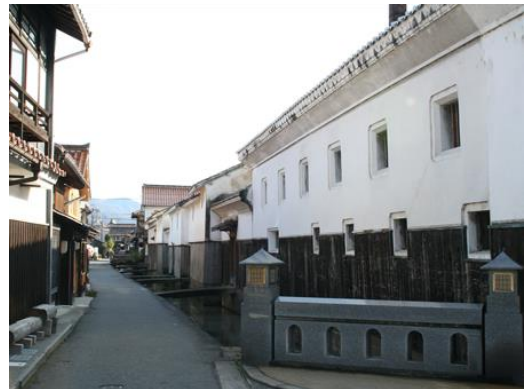
重要伝統的建造物群に選定された 白壁土蔵群