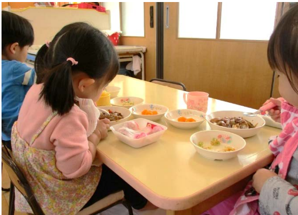
楽しい給食の時間