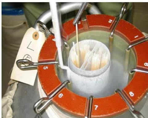
液体窒素に保存された凍結精液