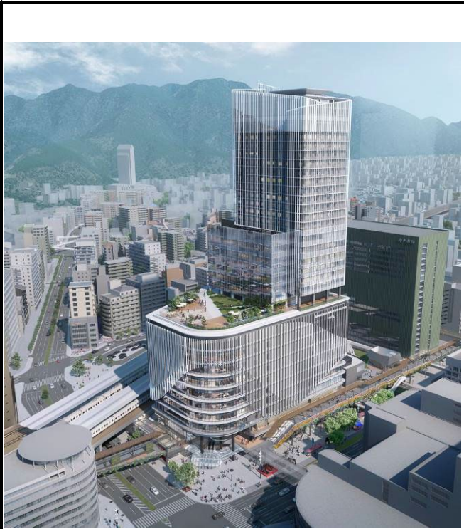
※パースはイメージであり、今後の設計及び関係機関との協議により変更となる場合があります。