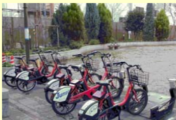
自転車駐輪施設の設置