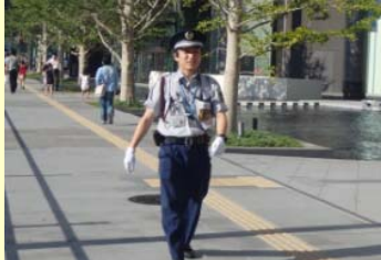
賑わいの創出に伴い必要となる巡回警備