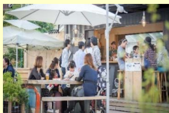
オープンスペースの活用