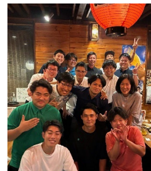
若者団体との交流