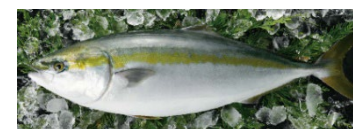
養殖鯛の水揚げ量日本一！