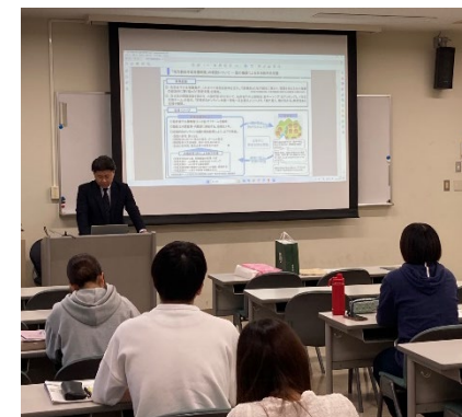
鹿児島大学でのワークショップの様子

町内に高校がないため、高校等進学とともに町を離れざるを得ない構造的な現状があり、働き手の確保が課題となっているところ、鹿児島大学法文学部自治体政策論ゼミと連携し、若者の視点から解決策を検討するワークショップを実施した。同大学とは来年度も引き続き連携を深めていく予定であり、長島町の交流人口拡大の観点から、具体的には、鹿大生の実地研修等を町内にある同大学施設で行うことについて協議を進めている。