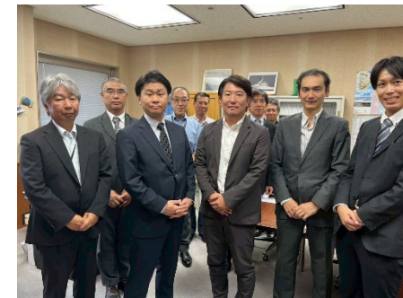
鹿児島県への要望活動

獅子島架橋において、これまでも町として国や県に対して陳情を行うなど精力的に活動していたものの、国等における架橋の機運醸成には至っていなかった。支援官が国交省とのミーティングを調整し、町と同省が直接ミーティングを行える環境を整備するなど、連絡ネットワークの形成に寄与した。また、県に対しては、町の要望活動に随行し、架橋に係る共通認識の形成を促したことによって、「獅子島架橋構想に係る長島町・鹿児島県連絡会」が設置されることとなり、実務者レベルの継続的な協議を進める環境が整えられた。