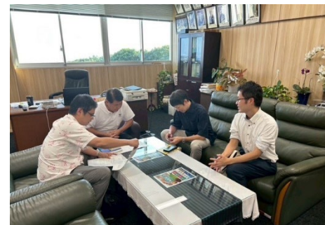
今井町長と支援官との打合せ