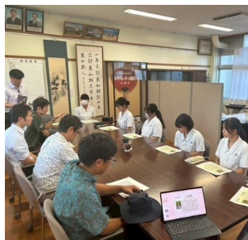
高校生との意見交換