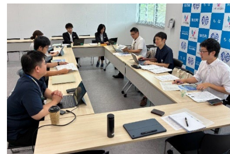
町担当者と支援官との打合せ