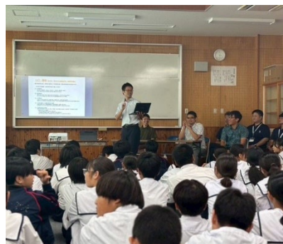
中学生に向けたキャリア講話