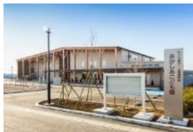
認定こども園 (H30.4開設)