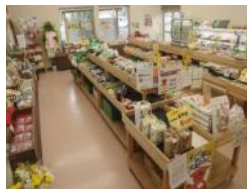
農産物販売所 (イメージ)