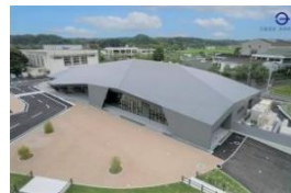
R5年5月長柄町新公民館「ながランホール」開館