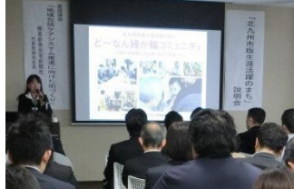
モデルエリア洞南地区での説明会