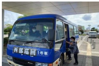
集落を結ぶ健康増進事業（巡回バス事業）