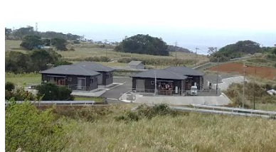
阿権校区住宅（4世帯24名入居）