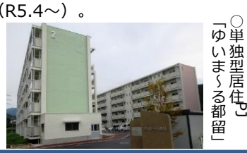
○単独型居住 「ゆいま 〜る都留」