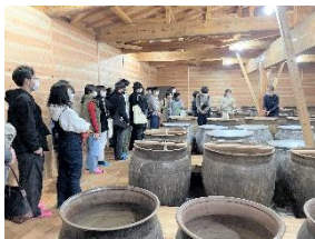
○学生主催 産官学連携イベント マイクロツーリズム

3校が連携し、生涯学習プログラム（まち魅力向上）、地域貢献事業（地域活性化）、相互の連携交流（大学質向上）など、「生涯活躍のまち・つる」の特色を強化する取組を実施。