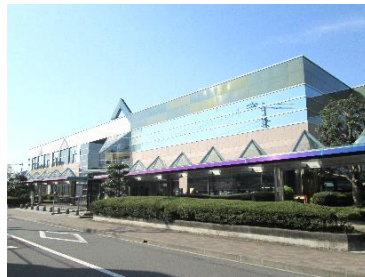
駿河共生地区 拠点施設 (静岡市地域福祉共生センター「みなくる」)