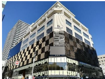
葵おまち地区 拠点施設 (札の辻クロス)