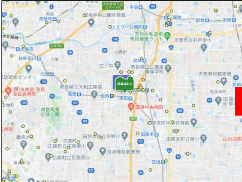
▼ユーザー分布図（2020年10月31日時点）