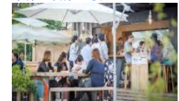
オープンスペースの活用