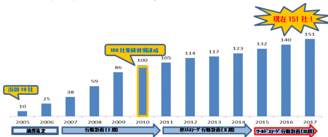
徳島県 LED 関連企業の集積推移

これらの取組により、様々な環境下で性能を発揮し、信頼性・耐久性に優れた製品開発や幅広い応用開発の技術・経験が蓄積されており、本事業で取り組む LED の新しい用途への応用や、テラヘルツ光など新しい光への挑戦の成果を、迅速に社会実装へ繋げることができる。