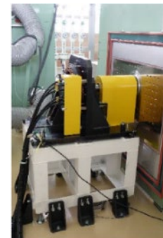
航空機推進用 大出力モーター