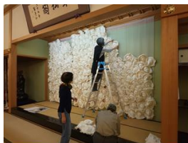
事業成果・KPI達成状況