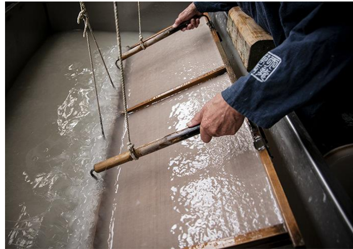
越前和紙（越前市）など、伝統工芸産地