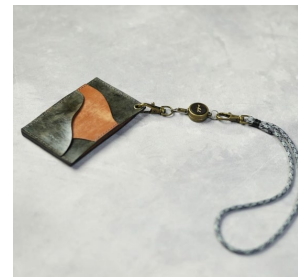
コラボ作品、レザー作家×炭パウダー