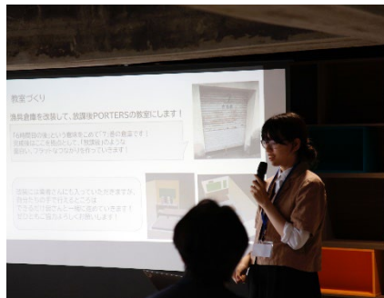
焼津でのサトヤマミライカイギミーティング