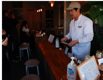
焼津でのTSUNALABO様と若者の交流