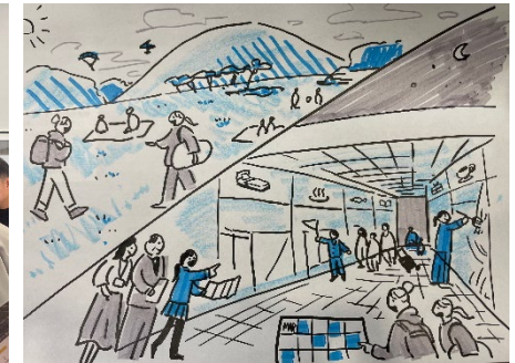
伊東商店街を活用したアイデア（例）