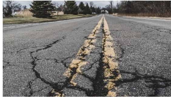
社会インフラの老朽化