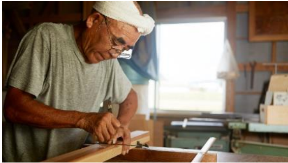
少子高齢化・後継者不足