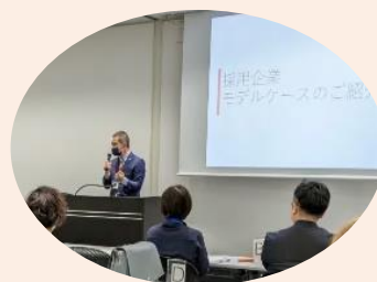
ネットワークミーティングの様子