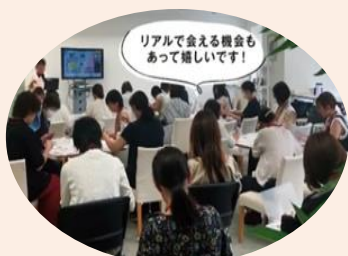
受講者ネットワークの様子