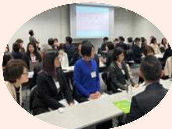
女性と企業の交流会の様子