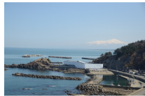
加茂港と加茂水族館