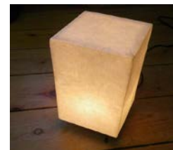
実践型地域雇用創造事業シンポジウムにて平成26年度ものづくり部門第1位を獲得した「和紙灯かり」