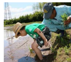
体験型観光モニターツアーの様子