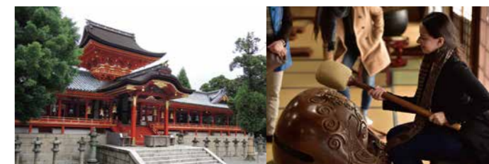
国宝 石清水八幡宮本社