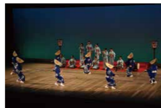
高校生による伝統芸能