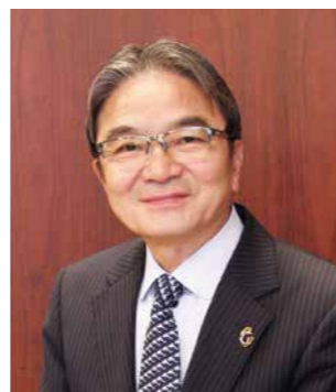
文化庁長官 地域文化創生本部長