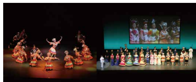
東アジア文化都市2017開幕式典