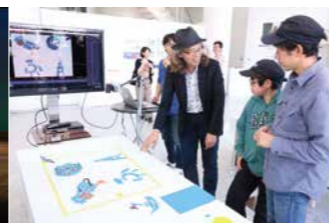
文化庁メディア芸術祭地方展(新潟展)