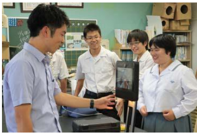
アバター設置場所（学校）