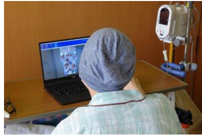
アバター操作場所（病院）