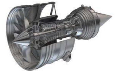
耐熱合金を用いる航空機エンジン