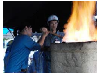
たたら操業実習（島根大）