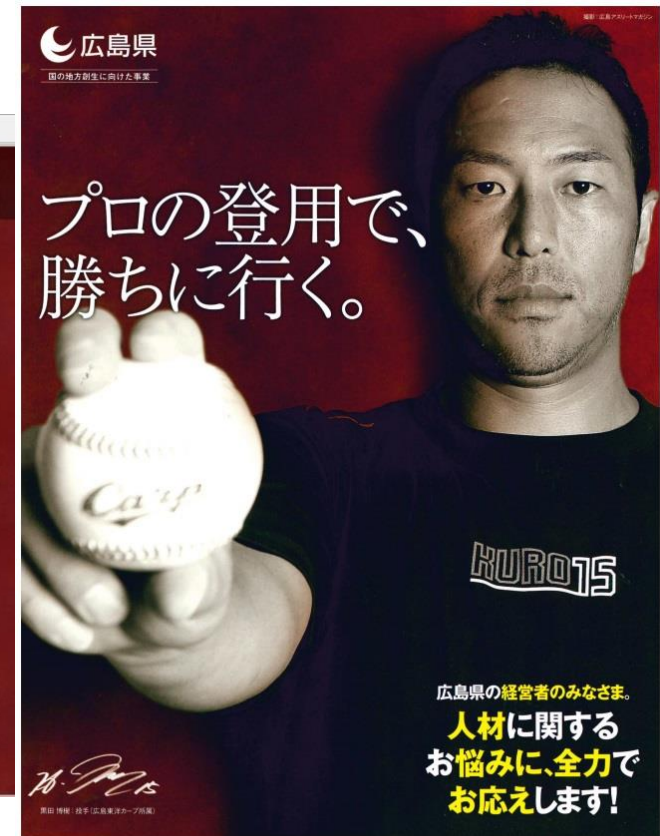
広島県プロフェッショナル人材戦略拠点