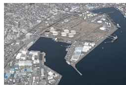
太陽光発電と大型蓄電池によるマイクログリッド（静岡県静岡市）