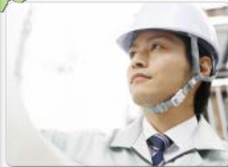
土木・建築技術者 (3.8)