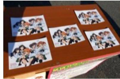
サイコロ振って「1」が出たらサイン入り!