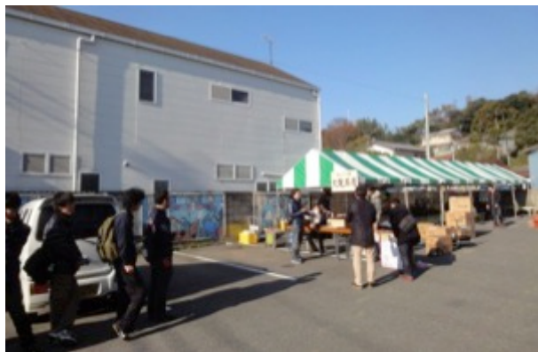
商店街の駐車場を借りてステッカー交換所&充電茶屋を設置。