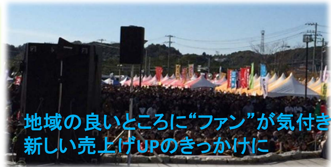
地域の良いところに“ファン”が気付き 新しい売上げUPのきっかけに