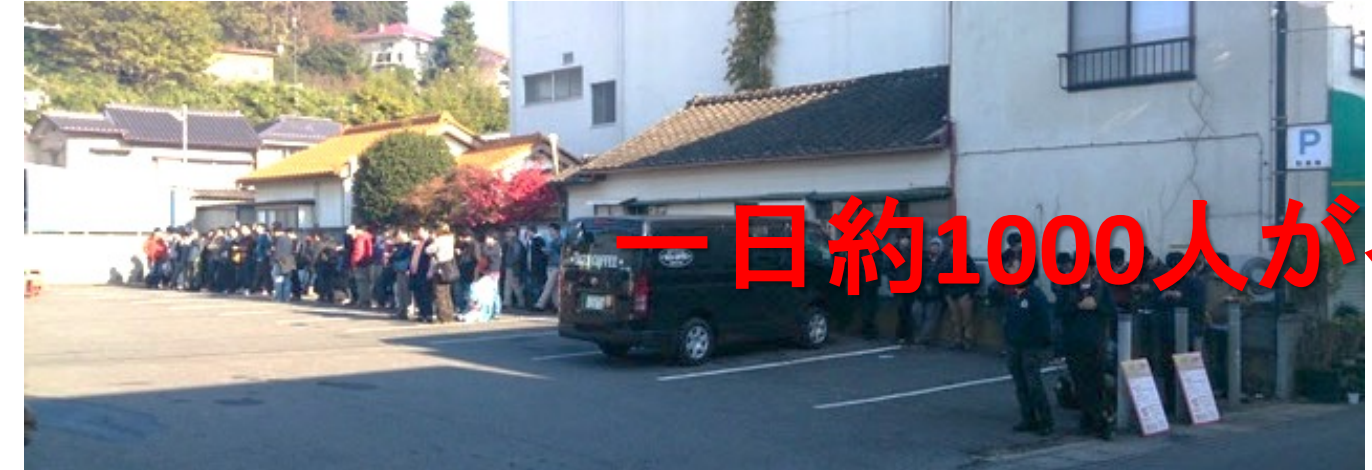
9時スタート直前. 約200人の行列. 先頭の方は朝7:15から待っていた。