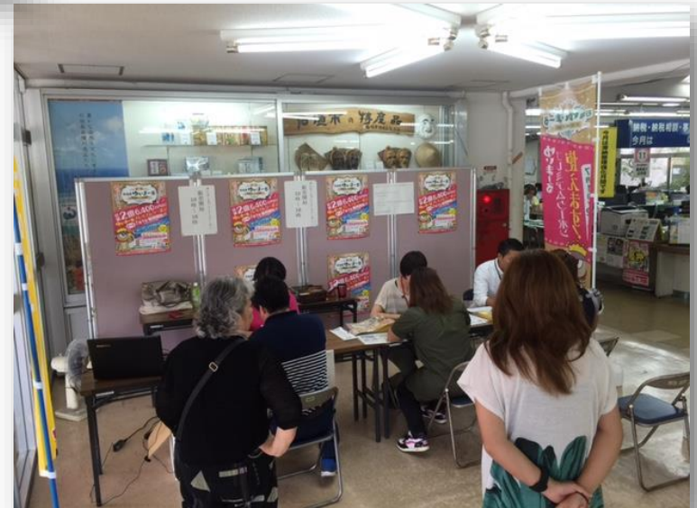
石垣市役所ロビーでの販売