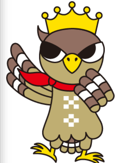
石垣市公認マスコットキャラ ぱいーぐる