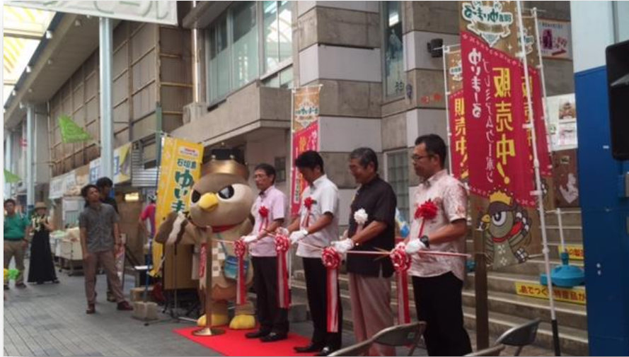
7月1日オープニングイベント

○発売日（7/1）に県産品奨励月間のPRと併せて、一般市民や観光客向けに、プレミアムクーポン発売のPRイベントを実施