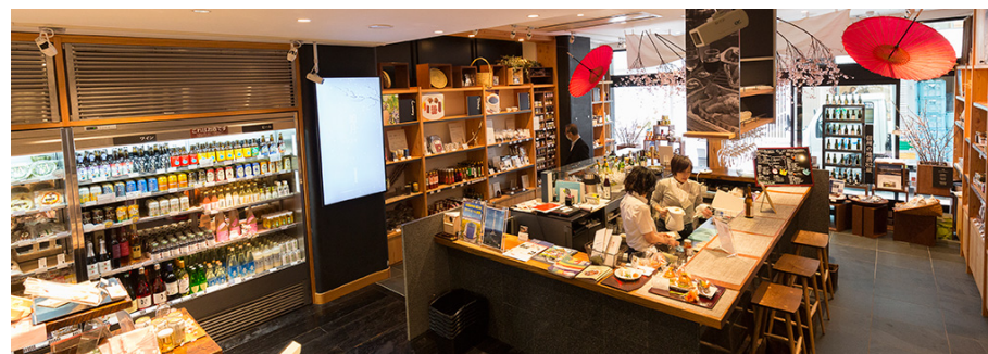
アンテナショップ 銀座NAGANO