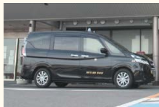
受診に合わせて自動でボランティアタクシー等を配車