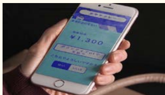
ボランティアポイントによる支払い