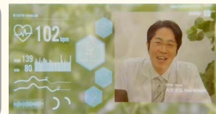
ウェアラブル端末のデータと連携した最適なオンライン診療