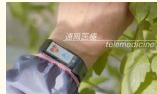
ウェアラブル端末の活用

○ウェアラブル端末の活用により、運動や食事データ等のライフログや医療データを連携し、健康～未病～治療のサイクルをシームレスにつなぐヘルスケアプラットフォームを構築。