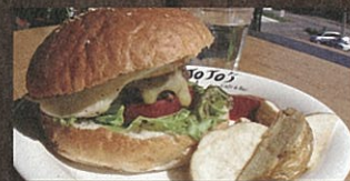
名物のハンバーガーをはじめメニュー豊富に取り揃えています。