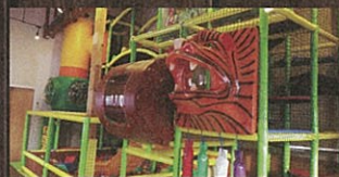
レストランには、遊具コーナー「キッズウィレッジ」もあるのでお子様も大満足です。