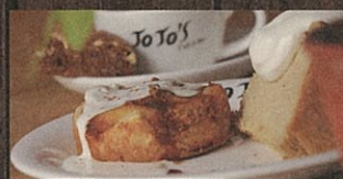
チョコレートブラウニーやスコーンなどスイーツもおすすめてです。