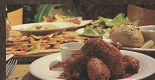
アクティビティの後の体感に、ドライブの途中に、のんびりとお過ごし下さい!