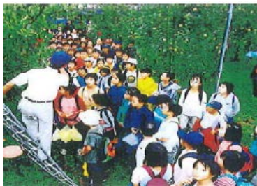
群馬県川場村 世田谷区との交流を促進