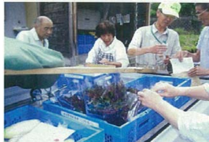
新潟県上越市櫛池地区 庭先集出荷