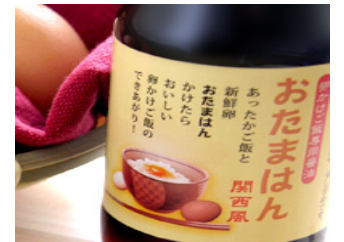
島根県雲南市 地元の農産物を加工

地域資源の活用等により小さなビジネスを営みつつ、民間主体で地域の課題解決に取り組み、地域コミュニティを活性化