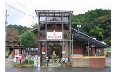
京都府京丹後市 チャレンジつねよし百貨店

マーケティング・経理事務など農山漁村に不足する能力を補強し、地域経済の発展に寄与