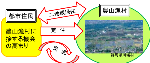
移住・定住等の促進イメージ

地域の仕事や暮らしに関する情報を豊富に提供し、農山漁村への移住・定住や二地域居住、Uターンを促進