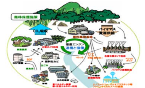
岡山県真庭市 真庭バイオマス産業都市のイメージ