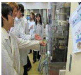
富山県薬事研究所