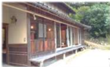
地方の魅力の再発見、発信