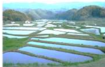
自らが生まれ育った 「郷土への誇り・愛着」の醸成