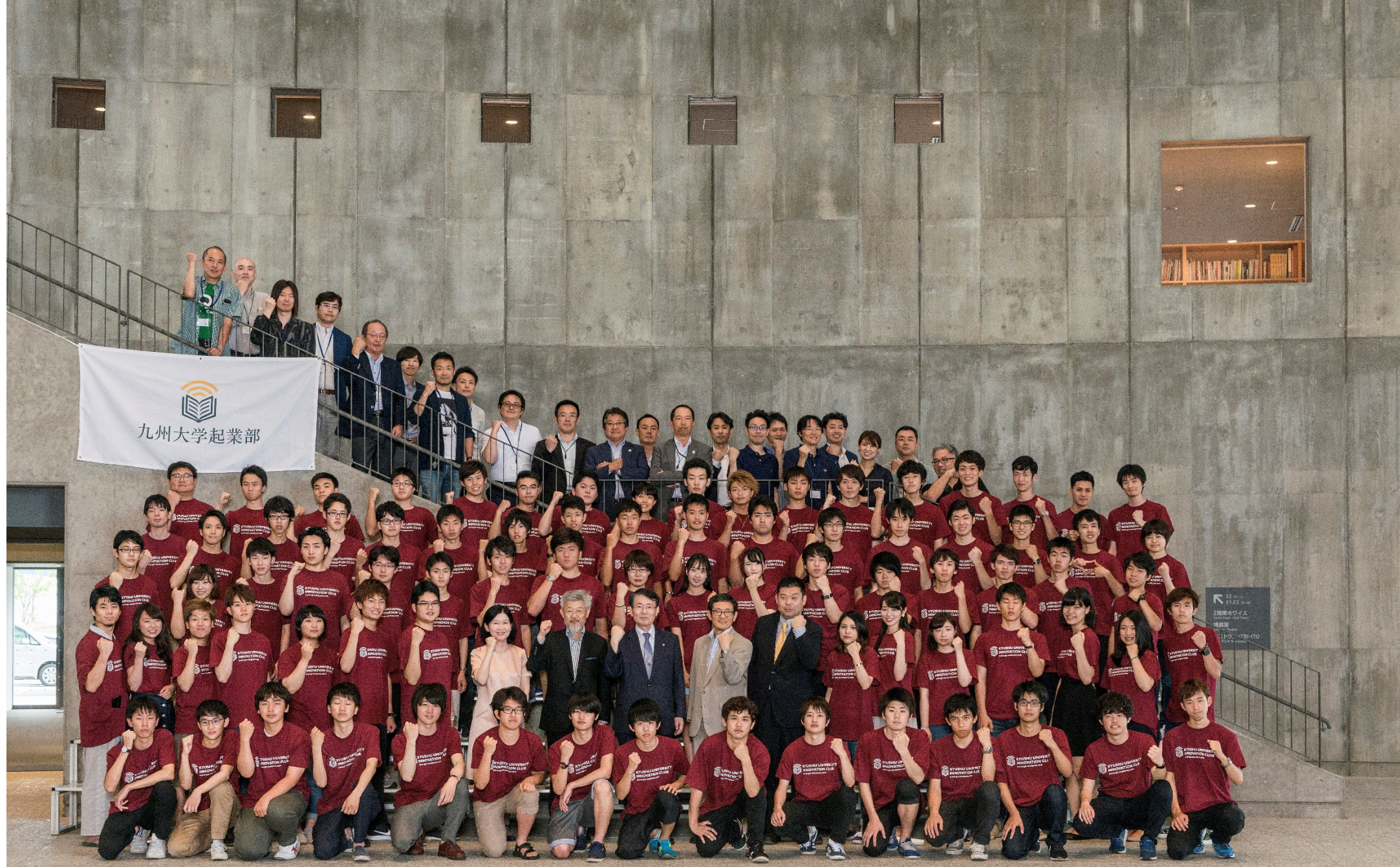
2017年6月23日・九州大学起業部設立（大学公認）