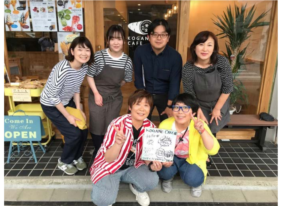
アンテナショップ外国人店長(右上)とテレビ取材風景