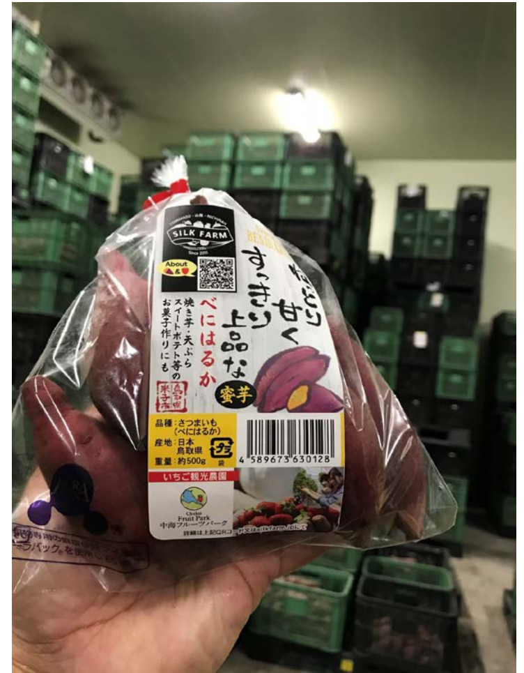
香港に送られるサツマイモのパック