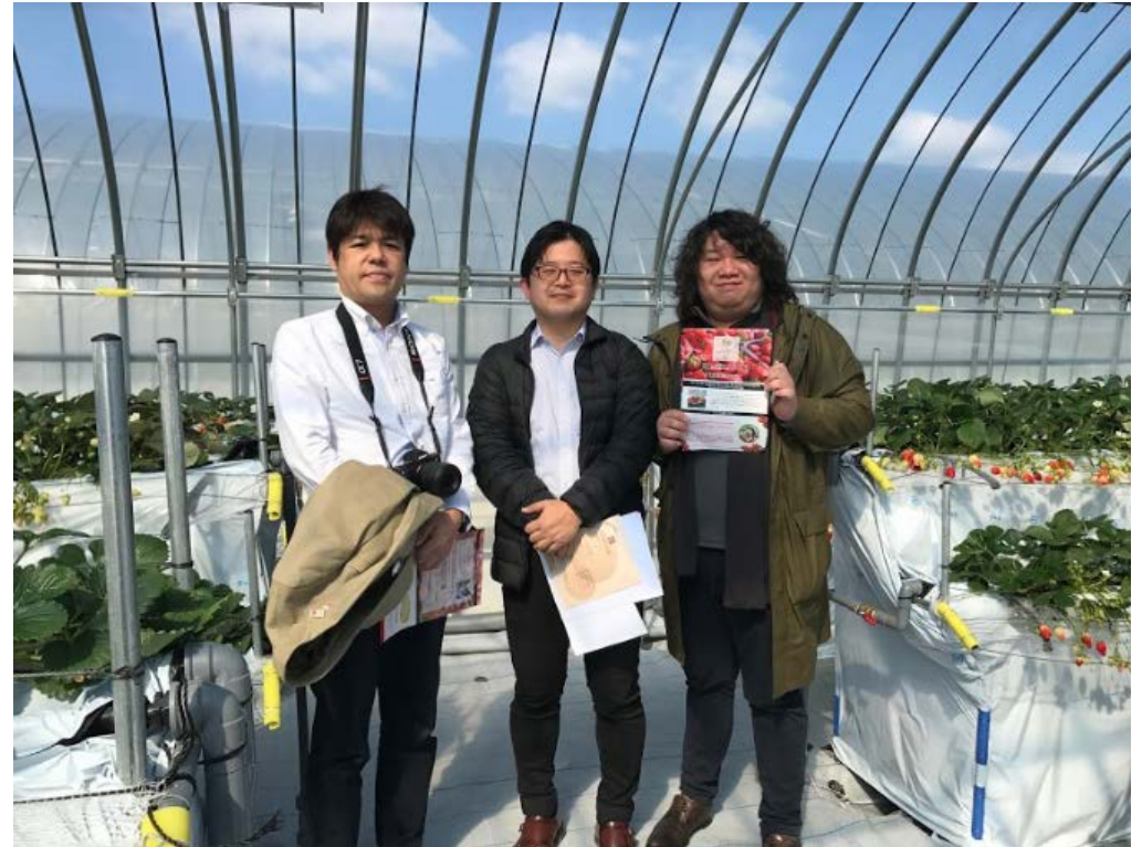
観光農園へ香港の旅行業界関係者視察の様子(本人は中央)