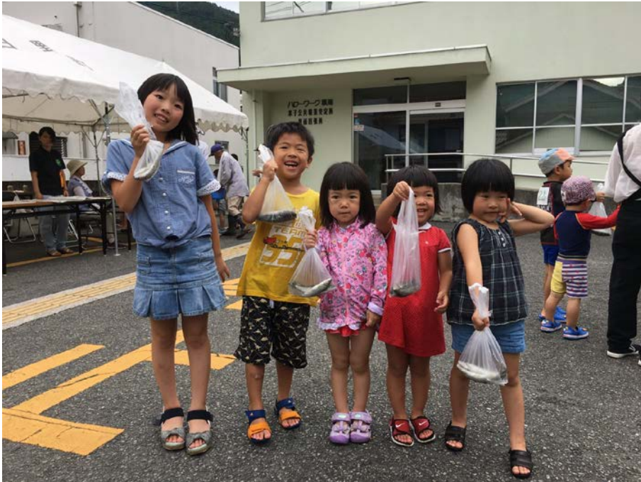
自然体験(鮎のつかみ取り)を楽しむ子どもたち