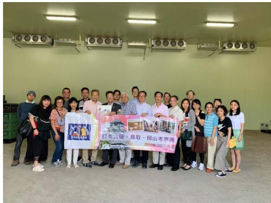
香港の食品業界視察団と大型冷蔵貯蔵施設にて