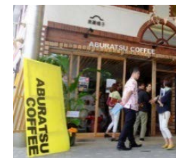
地域の拠点の整備