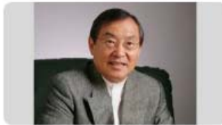
大前 研一 氏 (2/2) ビジネス・ブレークスルー大学 学長