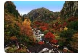
クリックで写真を拡大