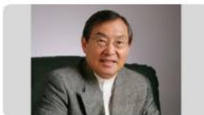
大前 研一氏 (2/2)